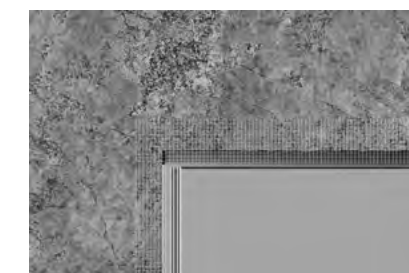
NASTRO COPRIGIUNTO (non fornita)

Utilizza il nastro copri giunto adesivo prima della stuccatura.