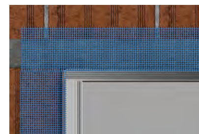
RETE IN FIBRA DI VETRO (non fornita)

Utilizza la rete in fibra di vetro prima dell'applicazione della malta.